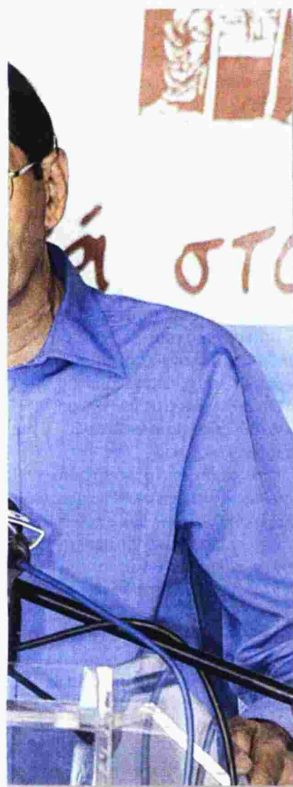
ίσει το θέμα κάνει, νίας Ομοσπονδίας

τας, που διαπίστωσε ότι τα αποθέματα επαρκούσαν το πολύ για ενάμιση μήνα, έσπευσε να δώσει χρήματα στον ΕΟΠΠΥ, ώστε να τακτοποιηθούν οι τρέχουσες υποχρεώσεις του. Τώρα βρισκόμαστε στην ίδια θέση, οι αρμόδιοι έχουν ενημερωθεί, η εντολή για την πληρωμή των φίλτρων είναι σε αναμονή... ενώ οι 12.000 νεφροπαθείς είναι «στο κόκκινο».