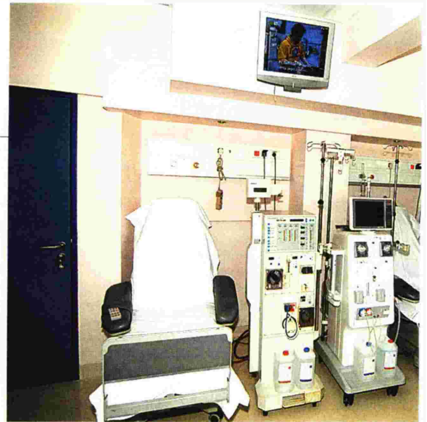
Σε έναν μήνα, όπως λένε οι αρμόδιοι, τα φίλτρα θα έχουν εξαντληθεί από τα νοσοκ